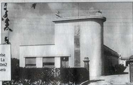
En 1950 est officiellement déposée la marque Bella. Un an plus tard, l'entreprise s'installe au 193 avenue de Rivesaltes. La superficie de l'usine est portée à 17 000m 2 au milieu des années 60. Le bâtiment sera démolé en 1988.